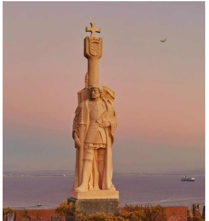
纪念碑纪念葡萄牙探险家卡布里奥 (Juan Rodriguez Cabrillo)