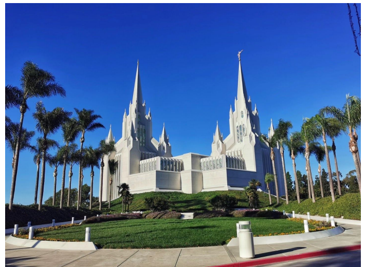
圣地亚哥圣殿 (San Diego California Temple)