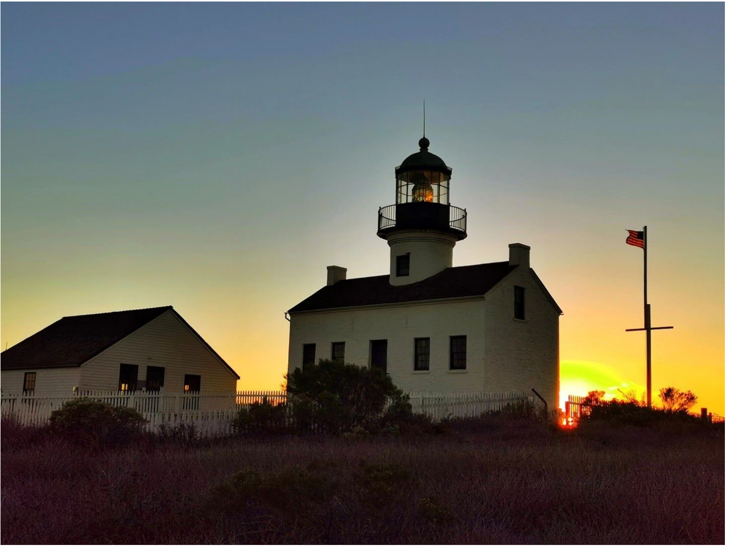
新诺玛角灯塔 (New Point Loma Lighthouse)