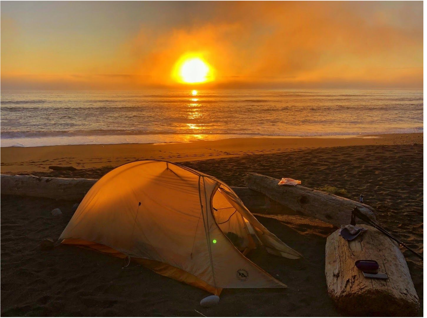
夕阳大海如此良辰美景，人生何求