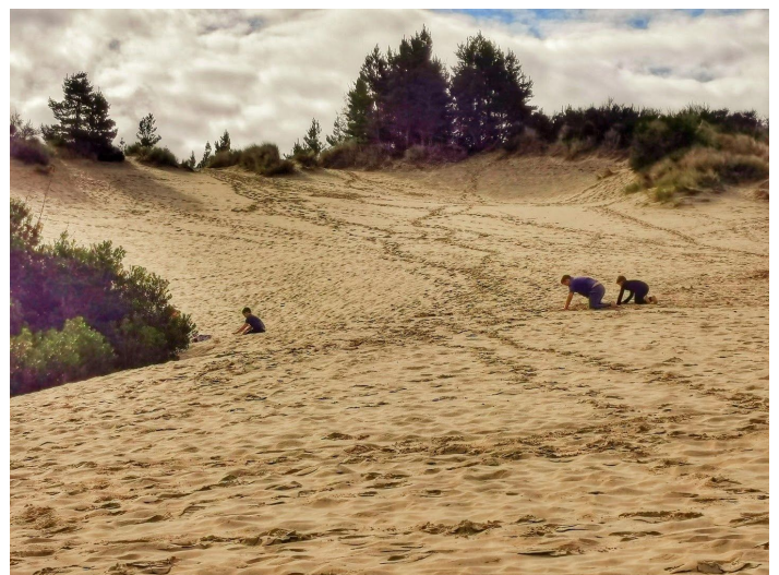
杰西·霍尼曼纪念州立公园,这是个以沙丘为主的公园