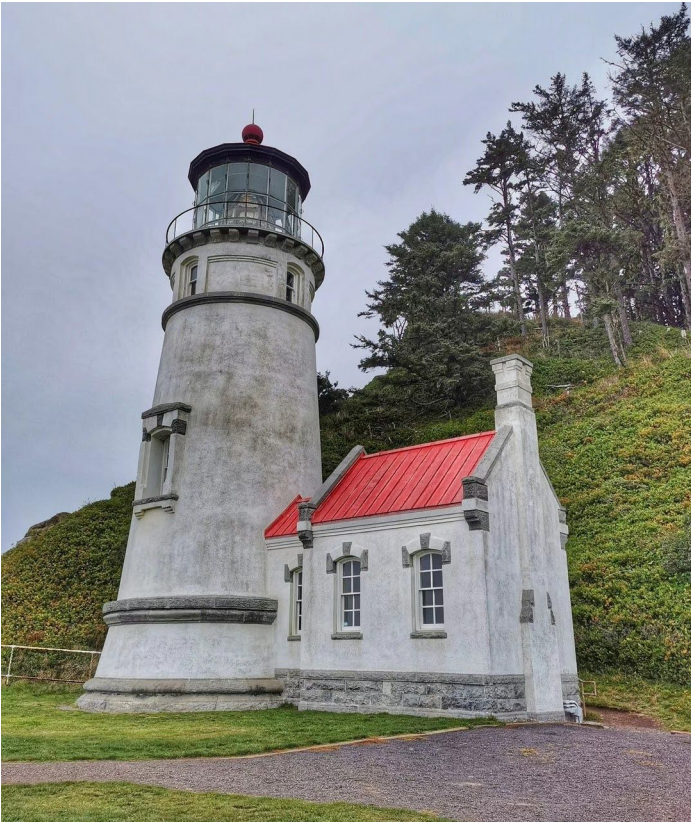
赫塞达角灯塔 (Heceta Head Lighthouse)