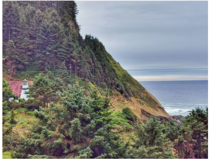
裂岩灯塔 (Cleft of the Rock Lighthouse)