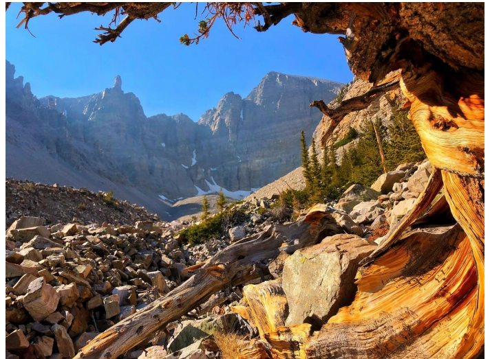
鬃毛松林（ Pinus longaeva ）