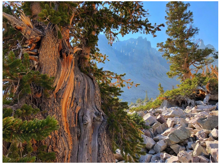
左上角的一小撮松针是柏松（Limber Pine）