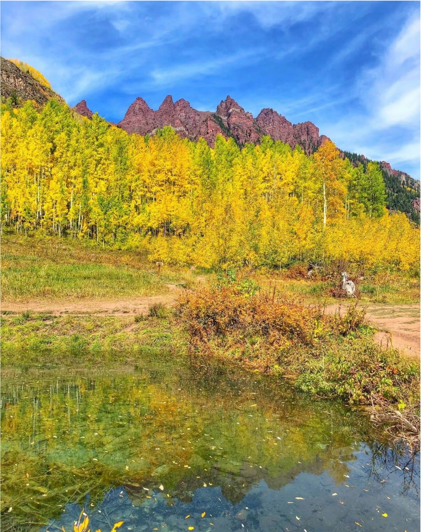
双子峰独特的褐色