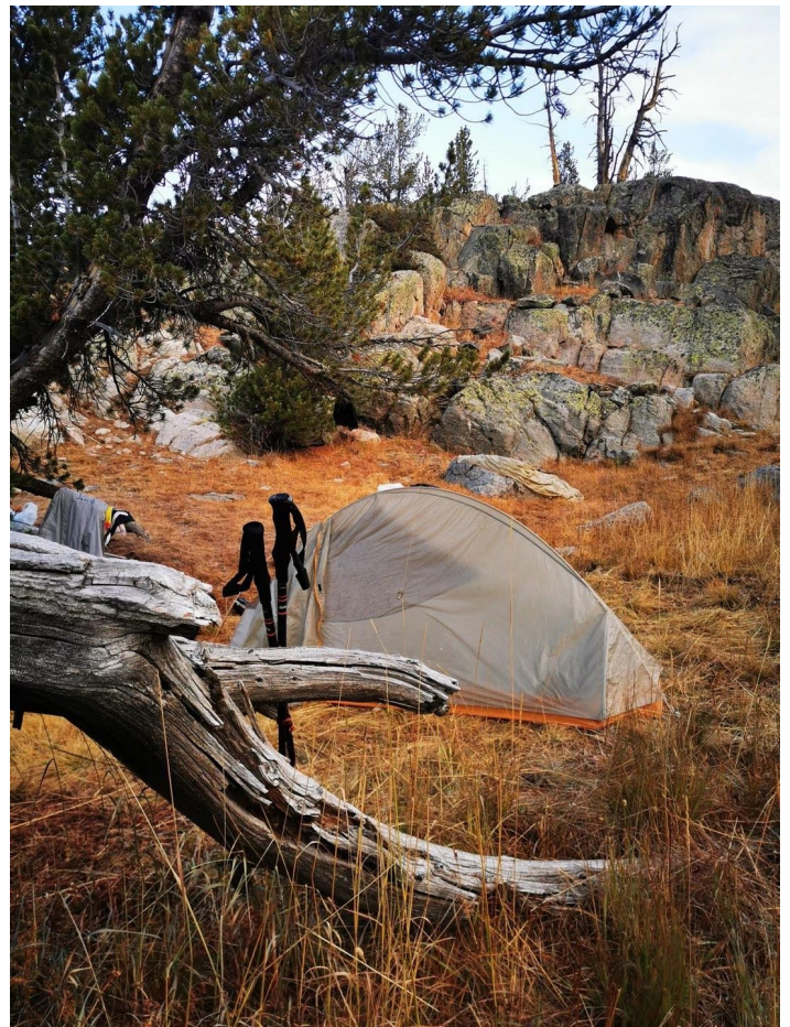
孤寂湖 (Lonesome Lake) 扎营过夜观日出