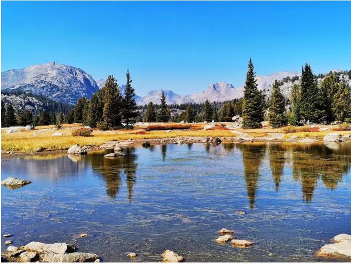
Flora跑到阴影湖边拍的塔峰近照