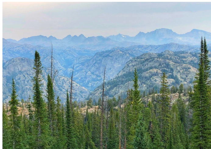
崖顶上远眺苍山如海