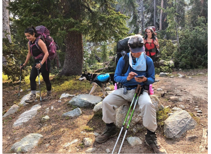
很感谢森林公园的山径维修人员的劳动，清理出大部分被倒树压住的小径