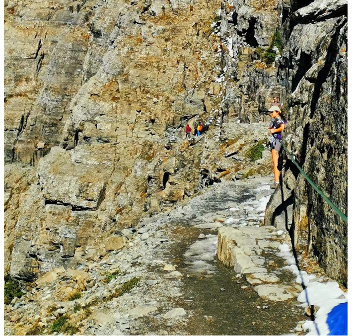
一段在悬崖上凿出的小径