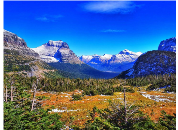
洛贡山口, 远处雪山依次闪出舞台