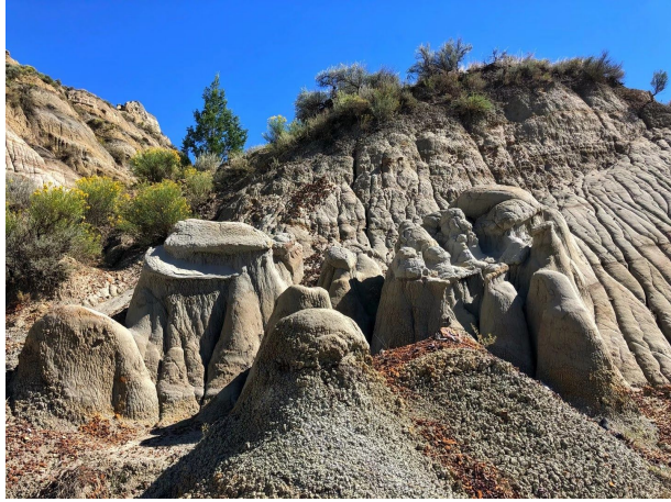
巫毒 (Hoodoo) 的景观