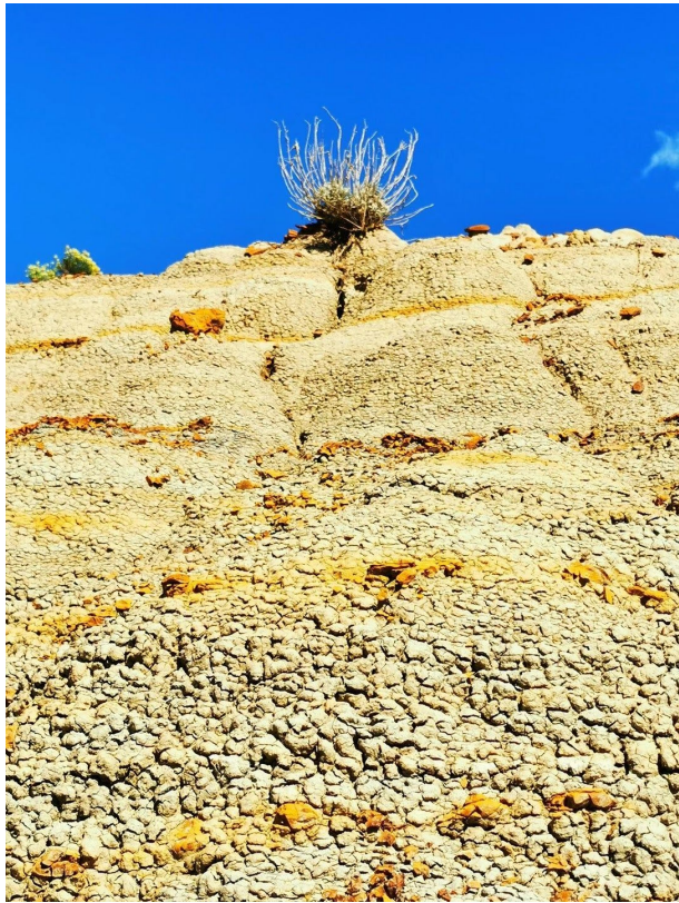
鹿角径 (Buckhorn Trail)