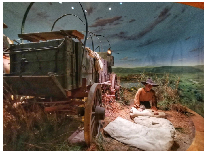
National Cowboy and Western Heritage Museum