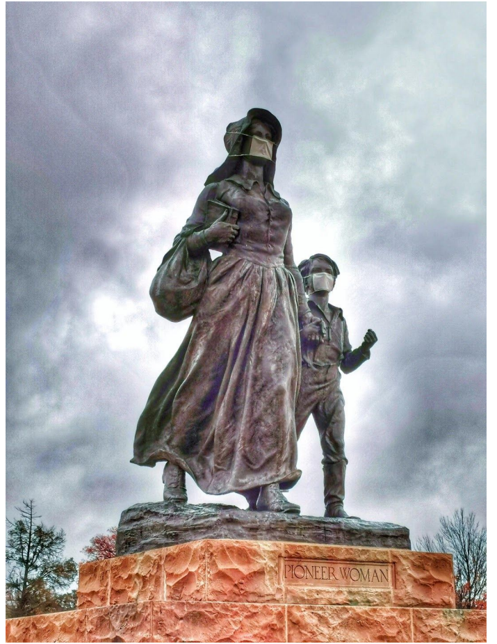
先驱女性纪念碑 (Pioneer Woman Monument)