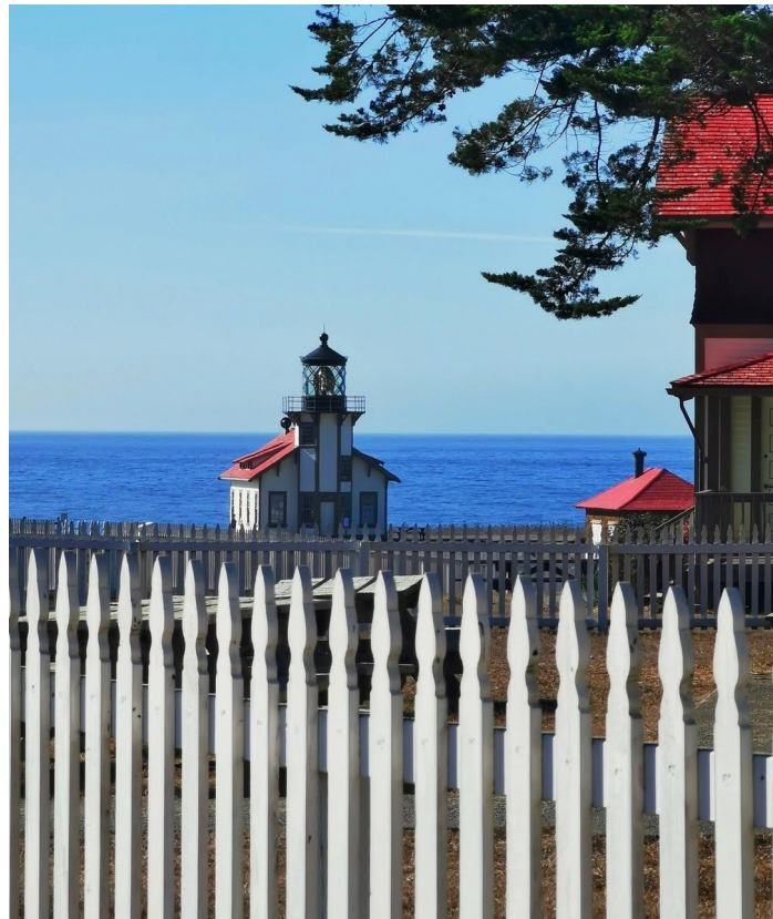
卡布里罗角灯塔 (Point Cabrillo Light Station)