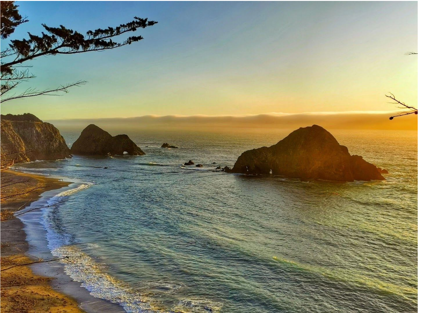
海湾沙滩上出现两座驼峰岩，一为单峰，一为双峰。驼峰下各有两个洞