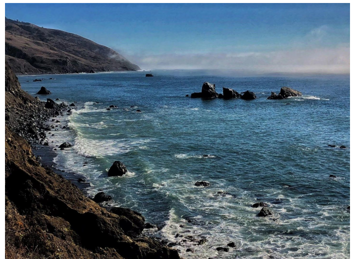
迷失海岸的起点马托尔滩