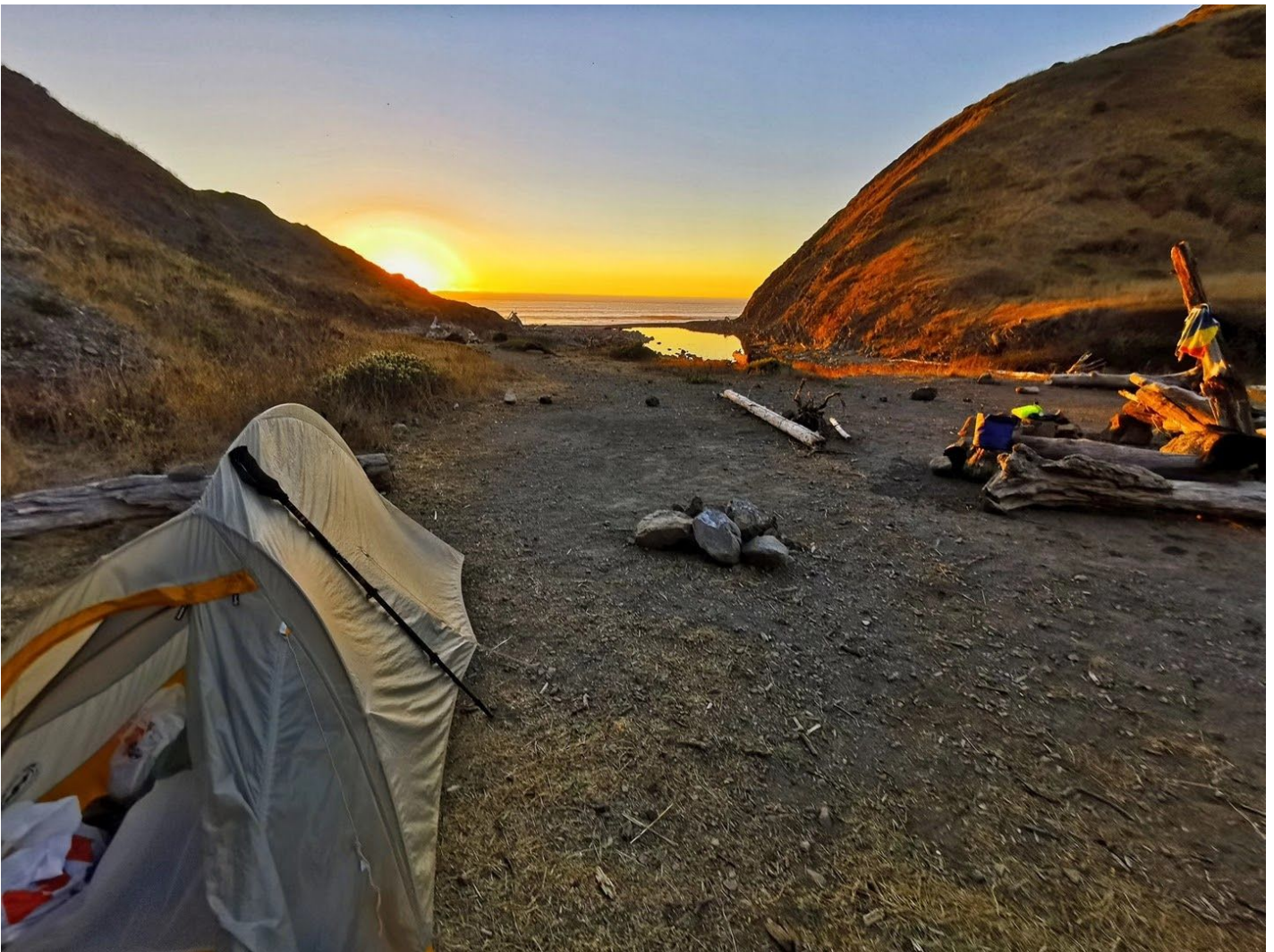
日落前在危险区中间的库斯奇溪 (Cooskie Creek) 扎营