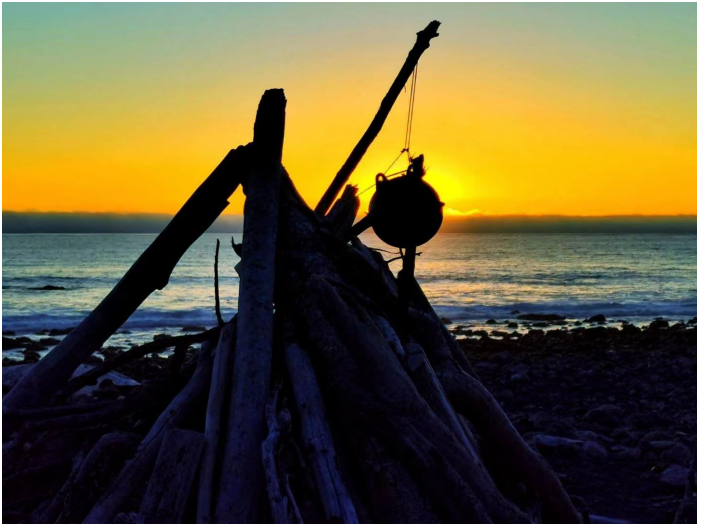
海狮沟 (Sea Lion Gulch)