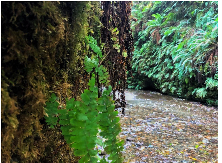
蕨谷, 以生长在50英尺高峭壁上的蕨类植物命名