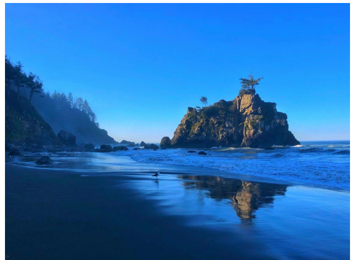
加州海岸径中途有一无名沙滩