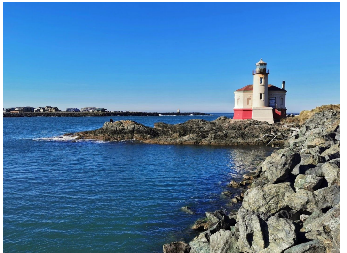
科奎尔河灯塔 (Coquille River Light)