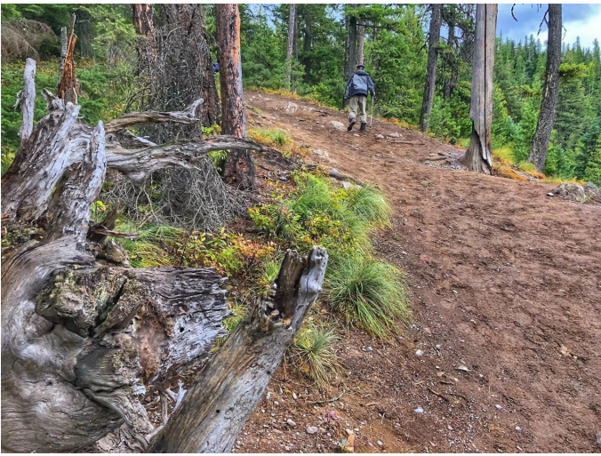
斯柏瑞径, 全程上坡