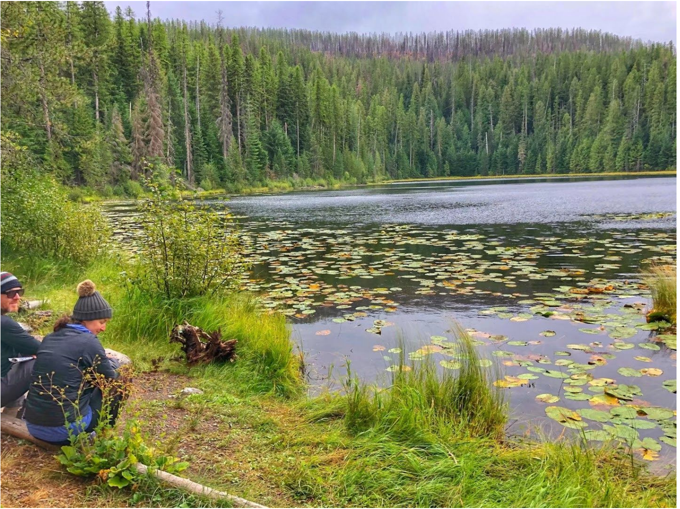
一对情侣喃喃细语