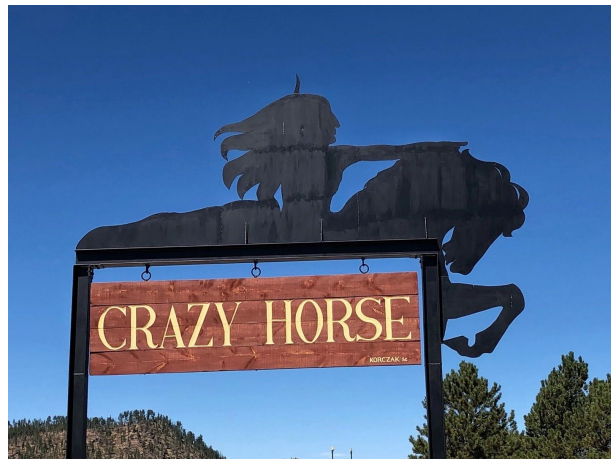
疯马纪念公园 (Crazy Horse Memorial)