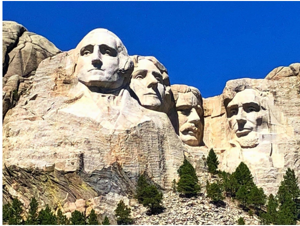
华盛顿，杰斐逊，老罗斯福和林肯