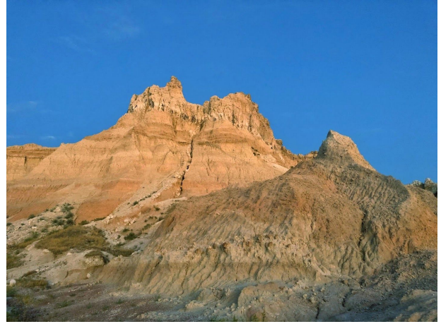
风穴国家公园 (Wind Cave National Park)